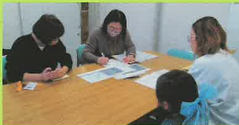
車で送迎のサポートです

ご依頼は益々増えています。提供会員にご興味のあるお友達やご近所の方にも、ぜひお声かけをお願いします。