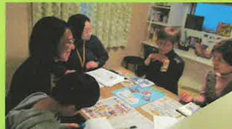
1月からサポート開始です

子育て支援員の資格をお持ちの方は、事業説明とまとめの講習のみの受講で提供会員になることができます。ぜひ、登録にお越しください。