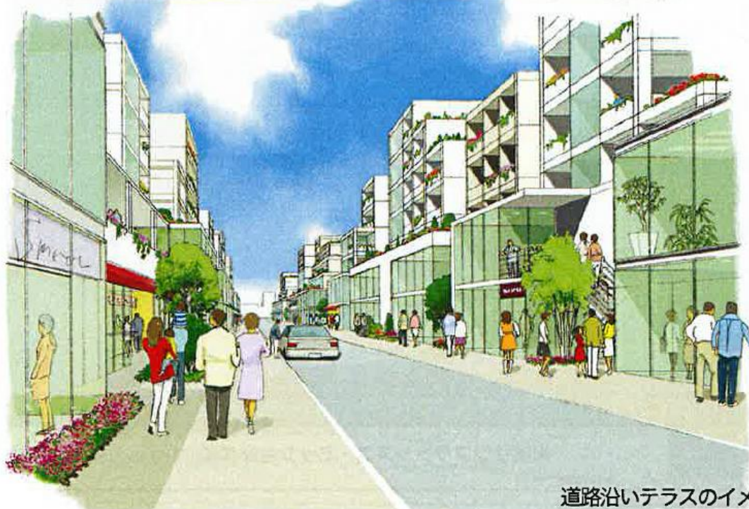
道路沿いテラスのイメージ

建物内の活動が外に現れ、市民が建物内外の活動に参加できる街 公共空間が快適で楽しい街、外に出たくなる街