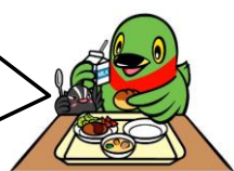
三郷市マスコットキャラクター「かいちゃん&つづちゃん」

保護者の皆さまからお預かりした給食費は全て給食材料の購入に充てております。給食費が未納になりますと、品質のよい給食材料の購入に支障をきたす恐れがあります。学校によって給食費の支払い方法が異なりますが、未納とならないようご注意ください。ご協力よろしくお願いたします。