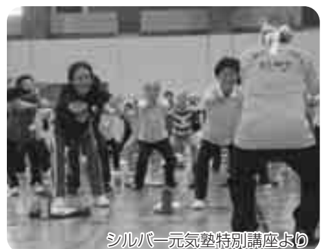
シルバー元気塾特別講座より

議員 「シルバー元気塾」と、「ゆうゆうコース」は、会場によっては希望者があふれ、