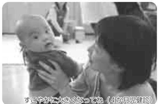
すこやかに大きくなってね (4か月児健診)

議員 妊婦健診は、妊婦や胎児の健康を守るために、大切な役割を担っており、望ましい回数には14回程度とされている。しかし、健診費用は、医