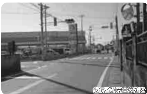
歩行者の安全対策を

かう反対側には歩道がない。押しボタンを押すのも大変危険であるとの声もある。そこで、今後の対策としてどのように考えているのか伺う。また、信号機のシステム変更が可能であれば、早急に対策を講じてほしい。 建設部長 信号待ちスペースがなく、とても危険な場所と思われる。信号待ちスペースの確保は、隣接する民地の買収、借用が必要になり、早急な対応は難しい。信号利用者や歩行者の安全確保の必要性は十分認識しており、道路管理者である越谷県土整備事務所に対し、対策を講じるよう要望したい。 その他の質問 教育問題など。