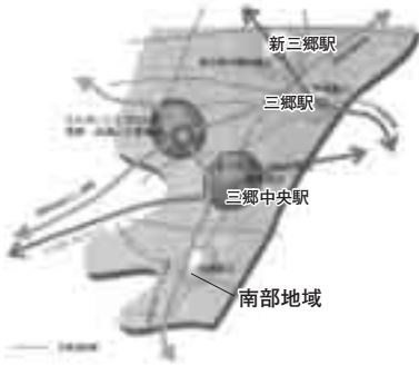
第3次三郷市総合計画の都市計画プラン