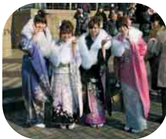
笑顔いっぱい 新成人おめでとう

私のいきいきライフは、"心を満たすなら、胃袋を満たせ"で足元の家庭から実行しています。