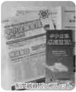
制度融資パンフレット

③地域経済振興対策として、地域の仕事興し、修繕・改修など小規模工事登録業者に発注する必要があるが、対策は。環境経済部長 ①雇用情報アドバイザーが市内事業所を直接訪問し、雇用労働情報の提