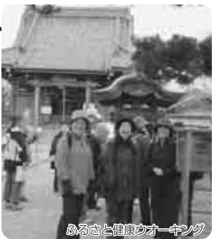
ふるさと健康ウォーキング