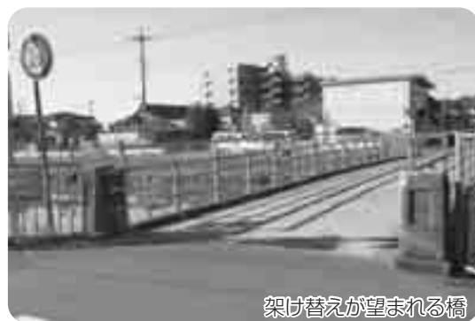
架け替えが望まれる橋