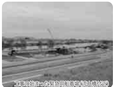
工事の始まった緊急用船着場(流山橋付近)

議員 当市は川に挟まれた地形から、災害発生時において、陸の孤島になることが想定される。そこで、水上輸送による緊急輸送路の確保が重要な課題である。江戸川に緊急用