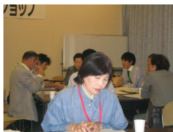
〈ワークショップの風景〉