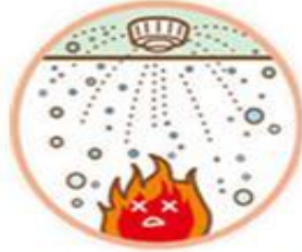
②スプリンクラー設備