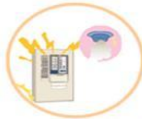
③自動火災報知設備