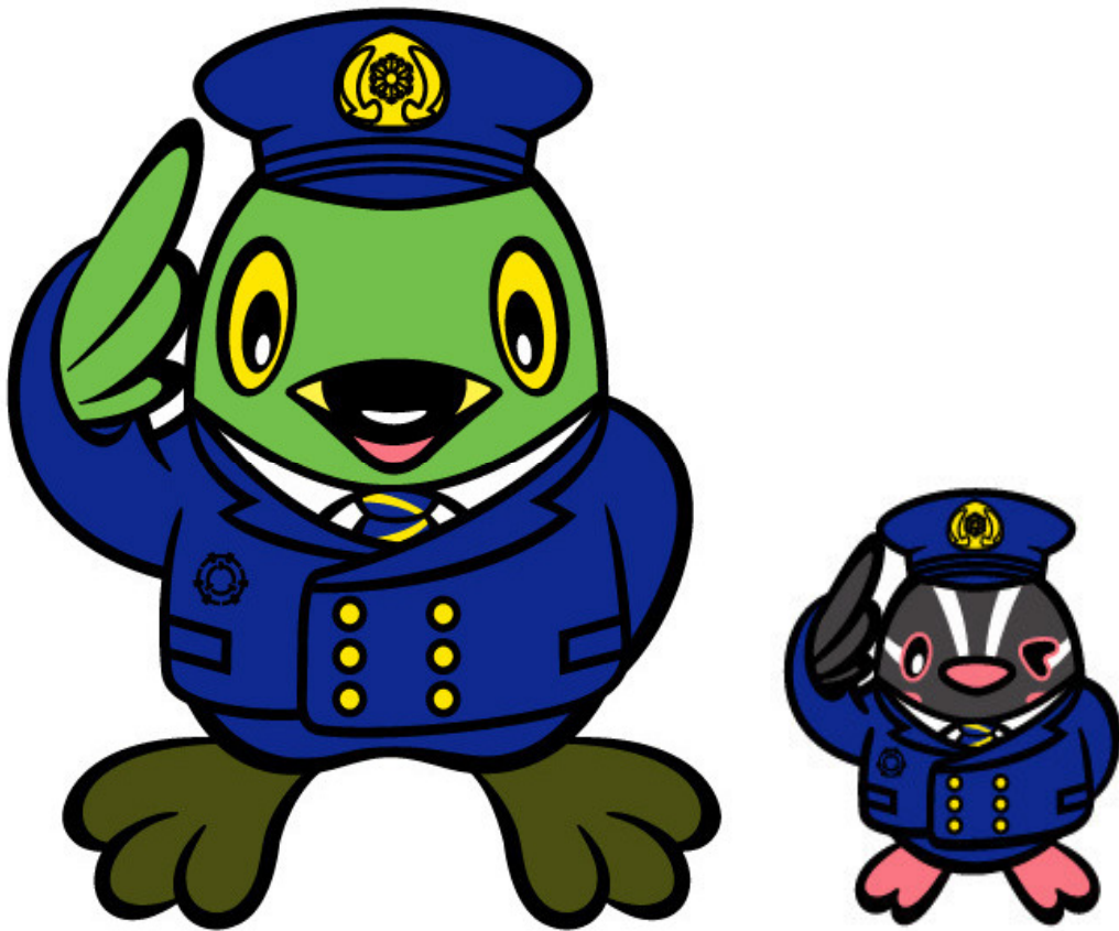
三郷市キャラクターかいちゃん&つぶちゃん