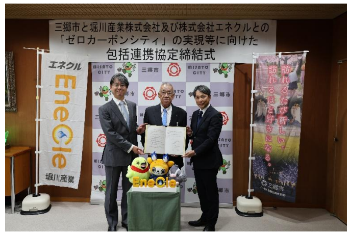
< 協定締結後の記念写真 >