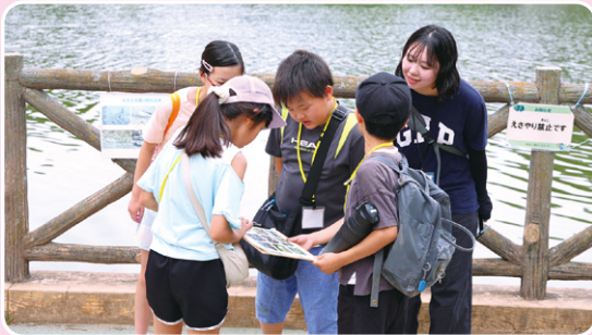
▲ 難しいミッションも協力して解決!

5月31日(日)、県営みさと公園で青少年相談員協議会が主催の「アゼリアクエスト」を開催しました。参加者は決められたチェックポイントを回り、6つのミッションに挑戦。班ごとに点数を競い合いました。学年を超えて互いに声を掛け合い、力を合わせてゴールを目指す姿がとても印象的でした。