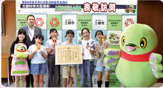
▲ 図書委員の皆さん

5月25日(月)、瑞木小学校の代表児童6名が「令和8年度子供の読書活動優秀実践校 文部科学大臣表彰」を受賞したことを報告しました。今回の表彰は、全国で67校が選ばれた名誉あるものです。当日は図書委員である代表児童により「エプロンシアター」が披露されました。臨場感たっぷりに「3匹のこぶた」を発表しました。