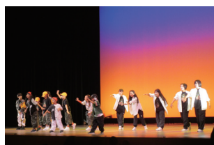
▲ホールでのダンスパフォーマンス

と き 9月23日(水・祝) と こ 東和東地区文化センター 対 象 級位者 申し込み 9月4日(金)までにハガキに住所、氏名、電話番号、大会名、囲碁・将棋及び棋力を記入し、市民活動支援課