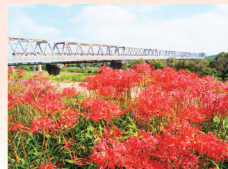
昨年度の入賞作品「秋色」