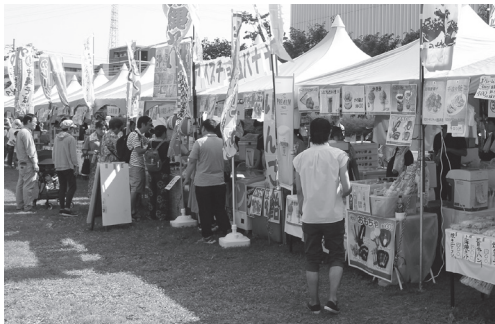
多くの飲食店でにぎわう様子