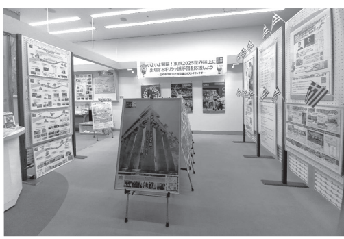
姉妹都市・サラミナ市の紹介も行います