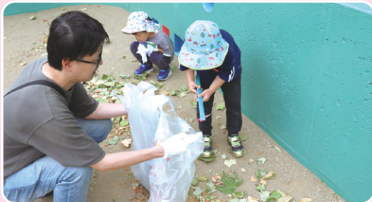
▲ いつも遊んでいる公園を綺麗に

5月31日(日)、市内全域の一斉清掃を行いました。朝早くから、こどもから大人まで多くのかたがたが参加し、まちが綺麗になりました。