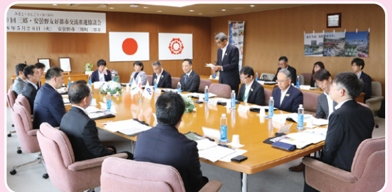
▲ 安曇野市、三郷町の皆さんにお越しいただきました

友好都市を締結し、今年で40周年を迎えます。今後の交流やお互いのまちの発展について話し合いました。また、三郷市の治水施設である新和調整池(みさと地下神殿)と市内の瑞沼学校給食センター(愛称:さとっ子スマイルキッチン)を視察しました。