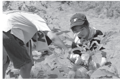
野菜を収穫してみよう！