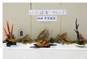
▲いけばなアレンジ