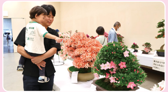
▲ お気に入りのさつきを見つけて

5月23日(土)・24日(日)、文化会館でさつき展を開催しました。市内愛好家が丹精を込めて育てたさつきが披露され、来場者は色とりどりの花や見事な枝ぶりに夢中の様子でした。