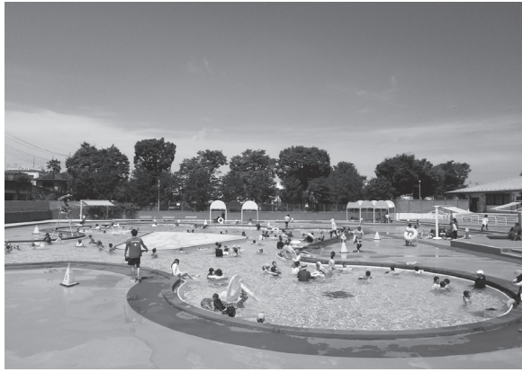
暑い夏はプールで楽しもう！