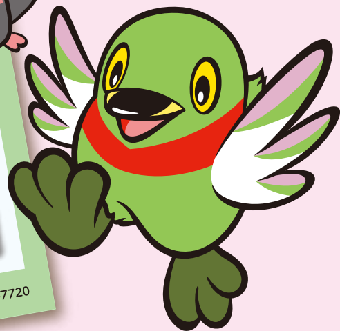
三郷市キャラクター かいちゃん&つぶちゃん