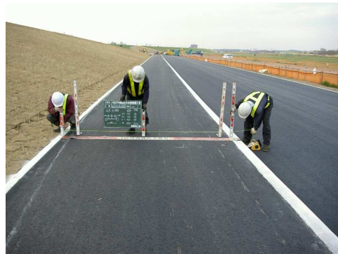
自転車道舗装完了