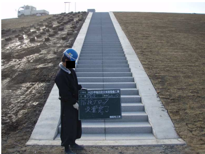
階段ブロック設置完了(下流側)