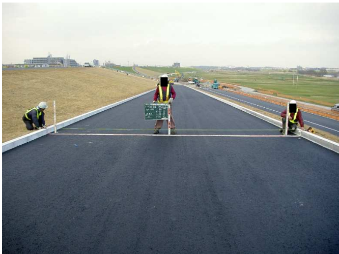
防災坂路舗装完了