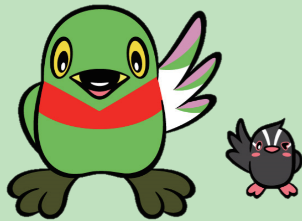
三郷市マスコットキャラクター かいちゃん&つぶちゃん