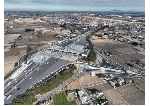
三郷料金所スマートインターチェンジ