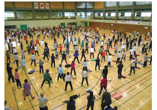
シルバー元氣塾特別講座スクワット