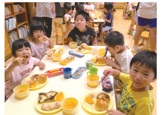
保育所での給食の様子