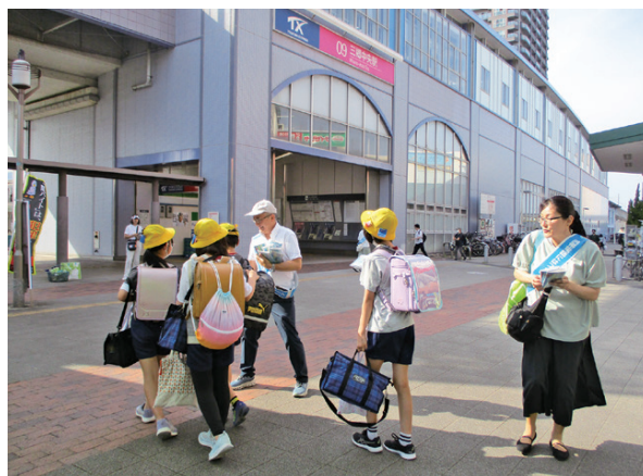
青少年健全育成啓発活動