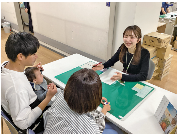
こども家庭センター