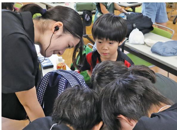
青少年リーダー活動