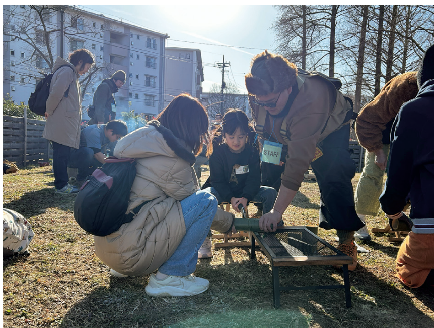
「こどもの居場所」づくりセミナー（プレーパーク体験の様子）