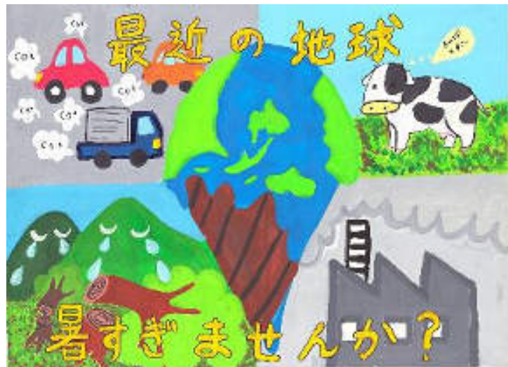
環境ポスターコンクール JFE条鋼賞