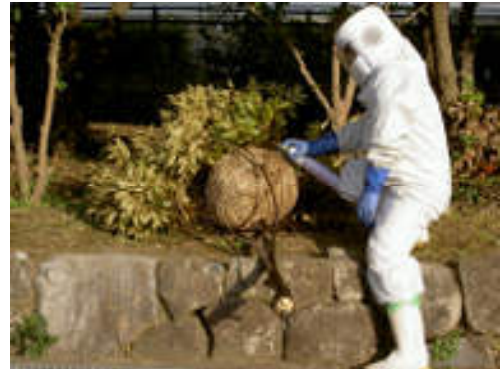
駆除専用業者によるスズメバチの巣撤去作業