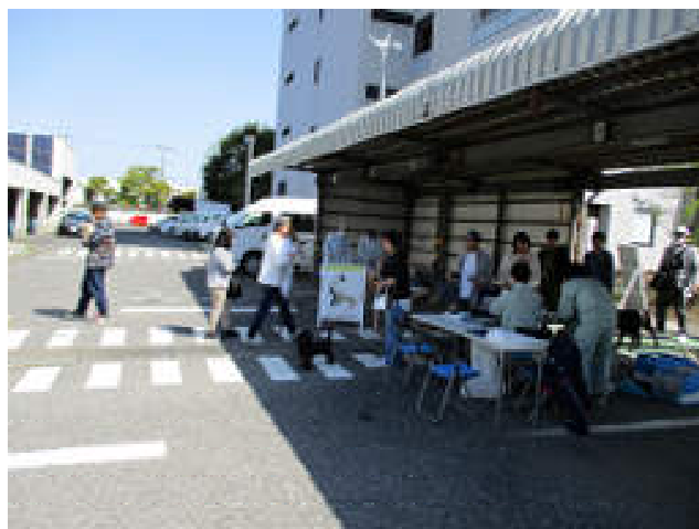
集合狂犬病予防注射会場の様子