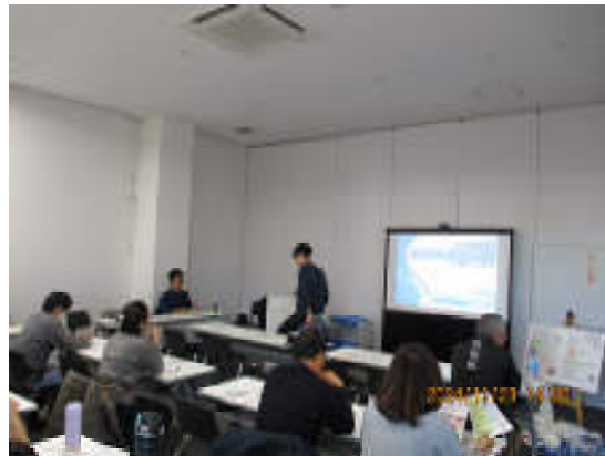
犬のしつけ方教室の様子

犬の飼い主におけるマナー向上及び飼育における適切なしつけを推進するため開催しており、令和6年度は、におどりプラザで令和6年11月23日（土）に開催した。「ペットに関する災害の備え」について講義を行った。