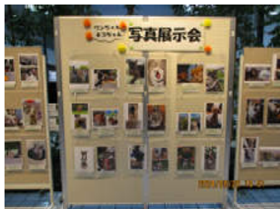
愛犬・愛猫写真展の様子（市民ギャラリー）

動物愛護週間に併せて、市民の皆様が飼っている愛犬・愛猫の写真を募集し、ららほっとみさと及び市民ギャラリーにて展示を行った。