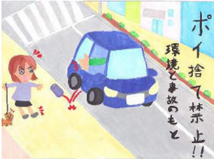
環境ポスターコンクール 前田道路賞