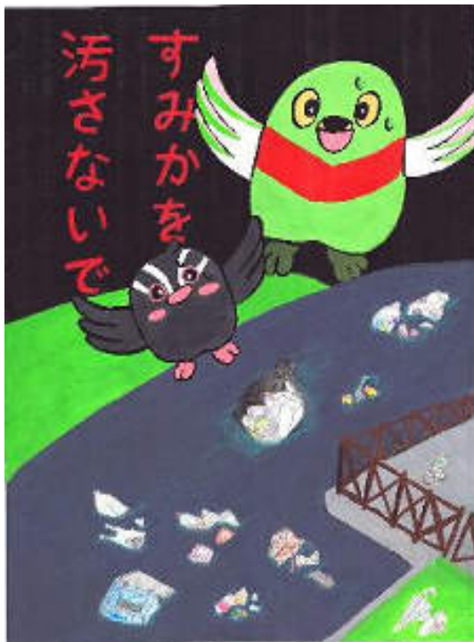
環境ポスターコンクール SDGs 賞（水辺系）