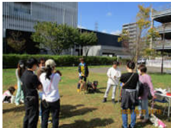
愛犬との暮らし方教室の様子

災害時の犬との同行避難を推進するため開催しており、令和6年10月20日（日）に、におどり公園にて開催した。お散歩マナー、グルーミング等のやり方について講義を行った。