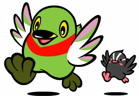
三郷市キャラクター「かいちゃん&つぶちゃん」