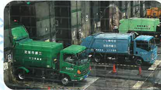
班員研修 越谷市のごみ処理施設(リユース)見学