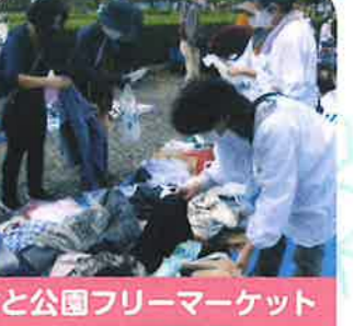
みさと公園フリーマーケット

班員さん募集中!一緒に活動してみませんか? 連絡先:健康推進課地域保健係048-930-7772