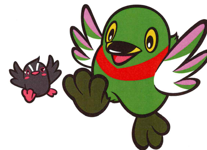
三郷市キャラクター「かいちゃん&つぶちゃん」