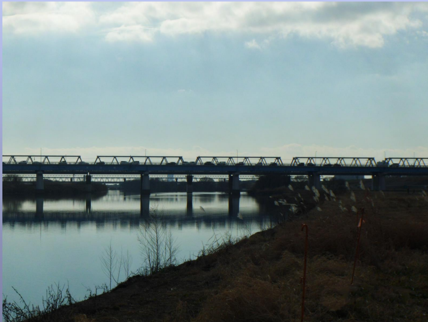
自然を感じる流山橋 受賞者 藤森 敦也