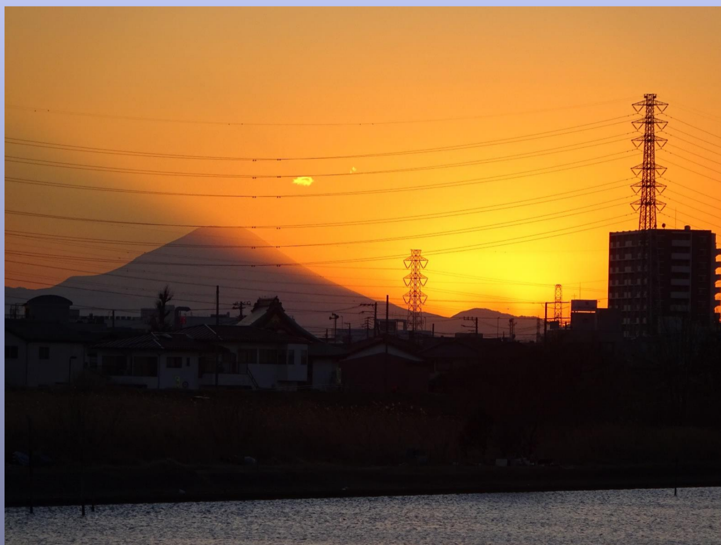
三郷の赤富士 受賞者 中井 勇