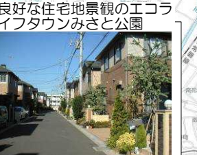
良好な住宅地景観のエコライフタウンみさと公園