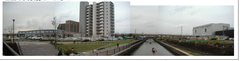
三郷中央駅周辺での新しい街づくり