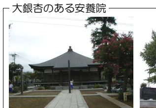
大銀杏のある安養院