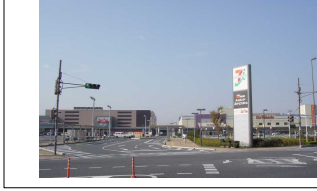
開発が進むインターA地区周辺