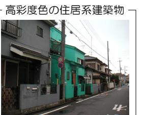
高彩度色の住居系建築物