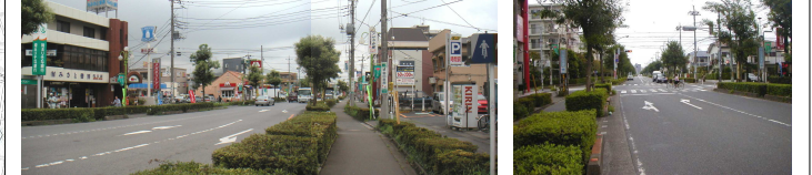
早稲田の軸となる早稲田中央通り沿道