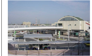
みさと団地方面の玄関口である新三郷駅