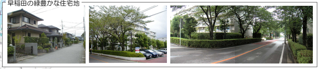
早稲田の緑豊かな住宅地