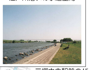
江戸川沿いの水辺空間