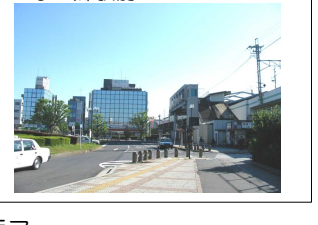
商業施設などが集まる賑やかな三郷駅前