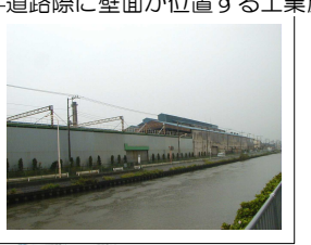
道路際に壁面が位置する工業施設