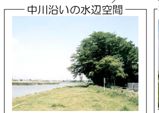
中川沿いの水辺空間