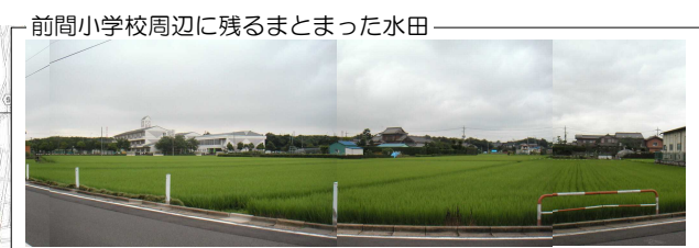
前間小学校周辺に残るまとまった水田