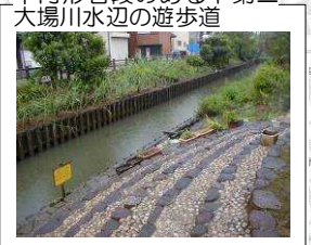
半円形石段のある下第二大場川水辺の遊歩道