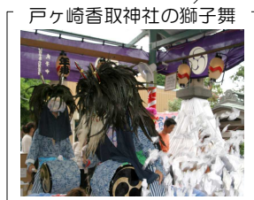
戸ヶ崎香取神社の獅子舞