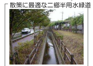
散策に最適な二郷半用水緑道