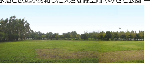
水辺と広場が調和した大きな緑空間のみさと公園