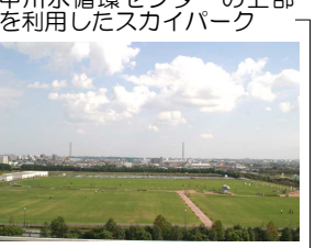
中川水循環センターの上部を利用したスカイパーク