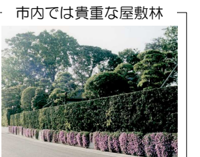
市内では貴重な屋敷林