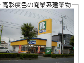
高彩度色の商業系建築物