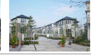
街づくりが進められている新三郷らシティ地区