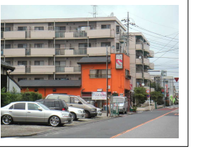
三郷中央駅前のパノラマ