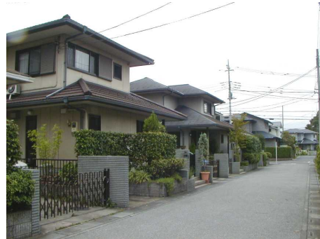
◆早稲田の住宅地 建築景観の調和を図り、外構や緑化にも配慮されている。