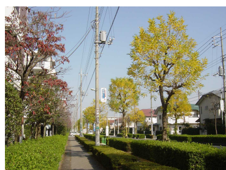
◆ 早稲田中央通りの街路樹 駅から離れると、商業地から街路樹と調和した住宅地へと変わる。