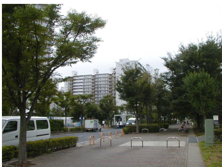
◆ さつき平の街路樹 幅の広い歩道には街路樹が茂っており、歩くのが楽しい空間となっている。