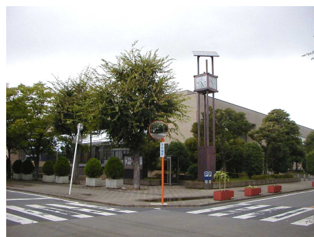
◆ 文化会館 隣接する早稲田公園と一体的に落ち着いたエリアとなっている。