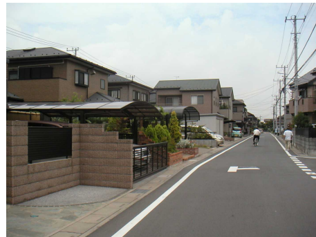
◆三郷中央地区の住宅地 景観に配慮した住宅地形成が図られ、建築物の色彩や建築形態が調和している。