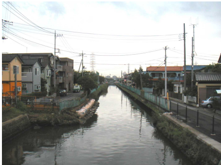
◆第二大場川沿いの住宅地 水辺に向かって住宅が建ち並んでいる姿をうまく活かしていきたい。