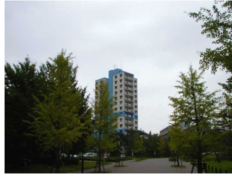
◆みさと団地の高層棟 周辺は空間にゆとりがあり、緑も多い。