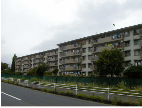
◆みさと団地の中層棟 早い年代に建てられた棟で、5階建てが建ち並んでいる。