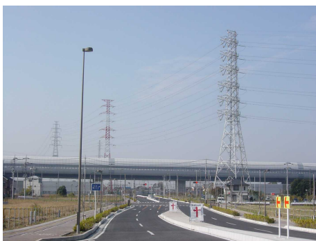
◆ 高速道路の高架 平坦な地形のため、市内各所から高速道路の高架を見ることができる。