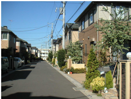
◆エコライフタウンみさと公園 一団の住宅地開発が行われ、良好な景観が形成されている。