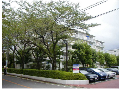
◆早稲田団地 建物周りでの緑化スペースが多く、緑豊かな住宅地が形成されている。