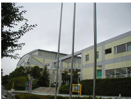
◆ 総合体育館 市内の公共建築物の中では、特徴あるデザインとなっている。