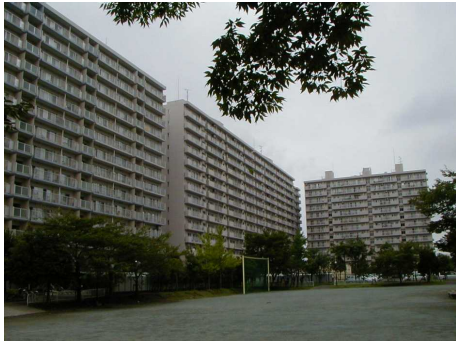
◆さつき平 みさと団地よりも新しい年代の団地で、統一感のある景観が形成されている。