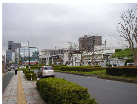
◆ 三郷駅前 駅を中心として商業・業務施設が集まっており、賑やかな雰囲気がある。