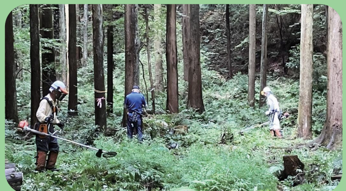
ボランティアによる整備