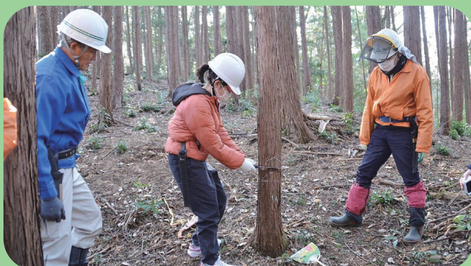
緑の少年団活動（間伐体験）