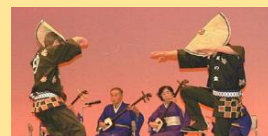
今回の市民教授 サークル新三郷のかた