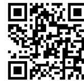
ネットトラブル予防