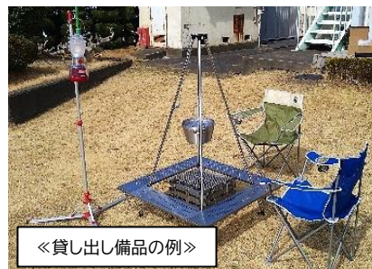
《貸し出し備品の例》