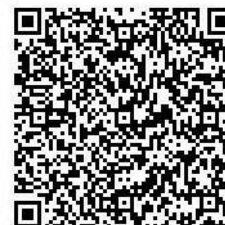
お申込(小・中学校・パパ)