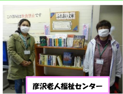
彦沢老人福祉センター