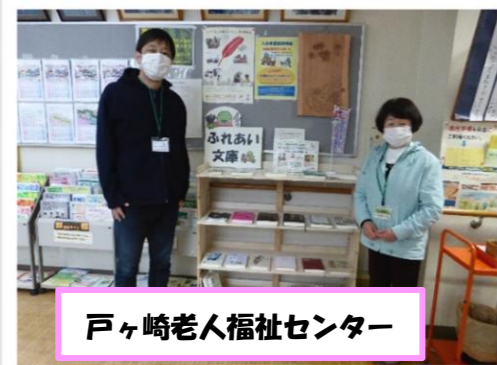
戸ヶ崎老人福祉センター