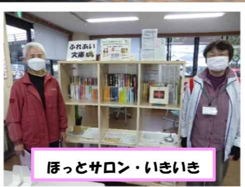
ほっとサロン・いきいき

市内に広がる「ふれあい文庫」をとおして、本と人をつなぐ新たなボランティアである「ふれあいブックサポーター」の活動が4月20日（水）からスタートしました。「ふれあいブックサポーター」は令和3年度に実施した「ふれあいブックサポーター養成講座」を受講した方々で、1期生16名が「ふれあい文庫」の日々のお手入れや本の入れ替え等を行っています。