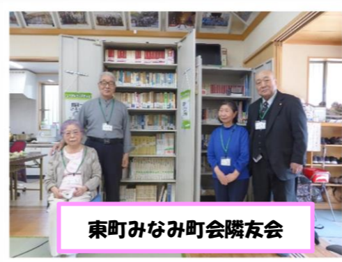
東町みなみ町会隣友会