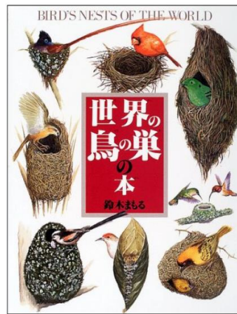
『世界の鳥の巣』鈴木まもる 作 岩崎書店

主催・問い合わせ 三郷市教育委員会 日本一の読書のまち推進課 TEL 048-930-7818 共催 日本児童図書出版協会、三郷中央におどりプラザ