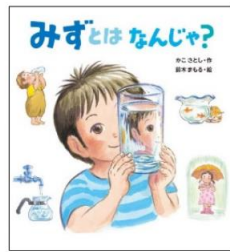
『みずとはなんじゃ?』 かこさとし 作 鈴木まもる 絵 小峰書店