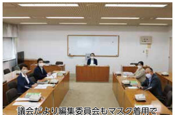
議会だより編集委員会もマスク着用で

※公職選挙法の規定により、議員の寄附行為や時候の挨拶などは禁止されており、本紙上をもつて、ご挨拶とさせていただきます。 三郷市議会