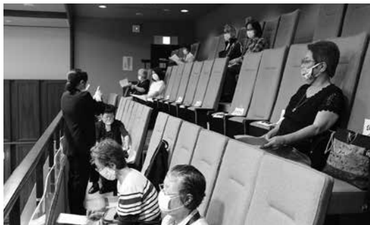
手話通訳により傍聴する様子