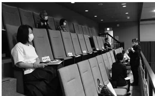
▲間隔をあけた傍聴席