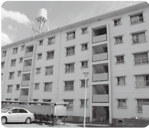
市営住宅横堀団地

よせが大きく、新型コロナウイルス感染拡大は低所得で安定した住まいを持っていない人の暮らしを脅かした。住居確保の必要性が求められているが、本市には市営住宅が49戸しかない。大広戸団地に関しては老朽化のため新たな募集は停止しており、戸数は減る一方である。このコロナ禍をきっかけに住宅政策を見直し、ハウジングブアを生まない社会をつくる必要がある。そこで、①低廉で安定した住まいである市営住宅を増やすべきだが考えは。②家賃補助制度や借り上げ制度の創設を求めるが考えは。③昨年度における市営住