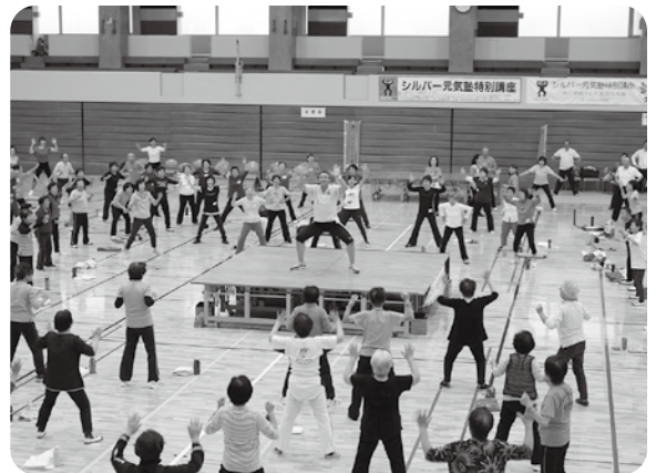
シルバー元氣塾特別講座