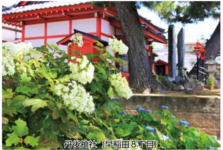
丹後神社（早稲田8丁目）

みさと団地（彦成4丁目）のピンク公園（通称）から、グラウンドにつながる一带は、桜やメタセコイア等の樹木が育ち、春の花見、夏の木陰、秋冬の木漏れ日等、四季折々の移ろいの風景を楽しめる癒し空間として気に入っています。しかし、残念なことにトイレがありません。公園やプールで遊ぶ子どもたちや親たち、グラウンドゴルフを楽しむ方々にとって、トイレを望む声は切実です。また、公園で遊ぶ子どもたちにとっては熱中症対策としての水飲み場やドロコになった手足を洗う水場が望まれるところです。