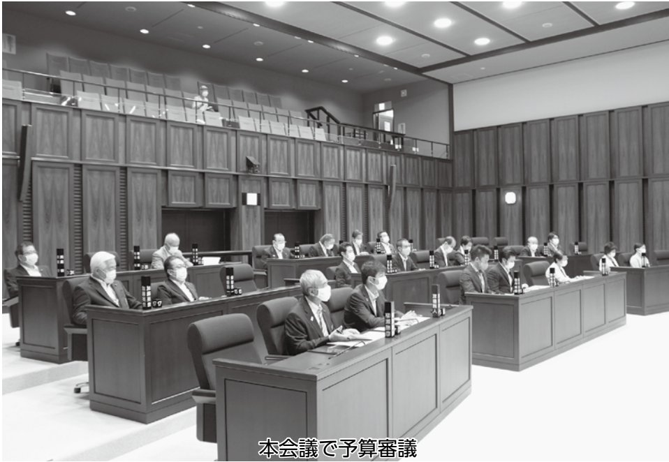
本会議で予算審議