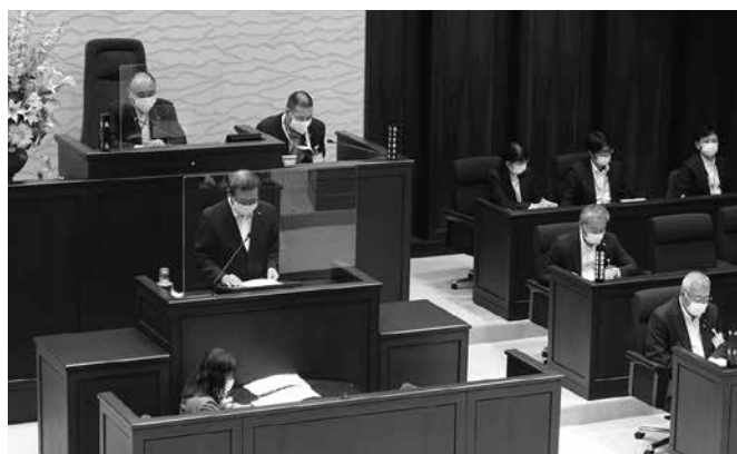
▲議長席と演壇にアクリル板を設置