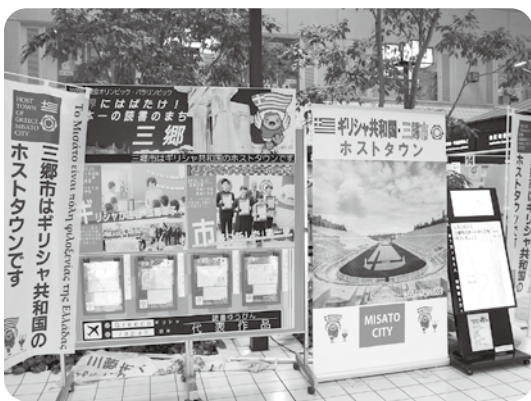
ホストタウンの取り組みなどオリ・パラ関連の事業