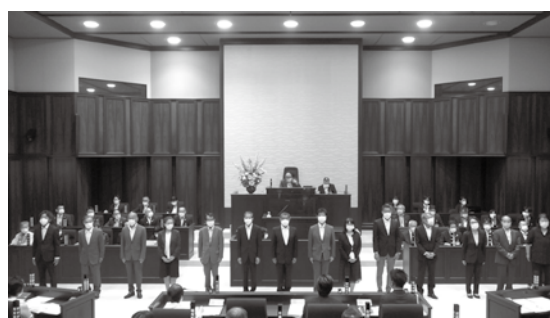
農業委員会委員14名が市長により任命