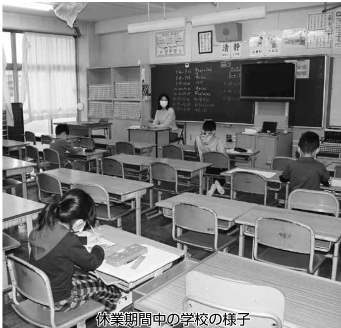
休業期間中の学校の様子